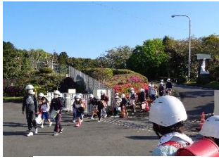
元気なあいさつを しながらの登校風景